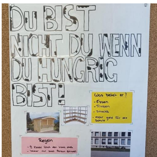
Die Schülerinnen und Schüler der 9. Klasse

Als Siegerprojekt ging der «Pausenkiosk-Stand» hervor.